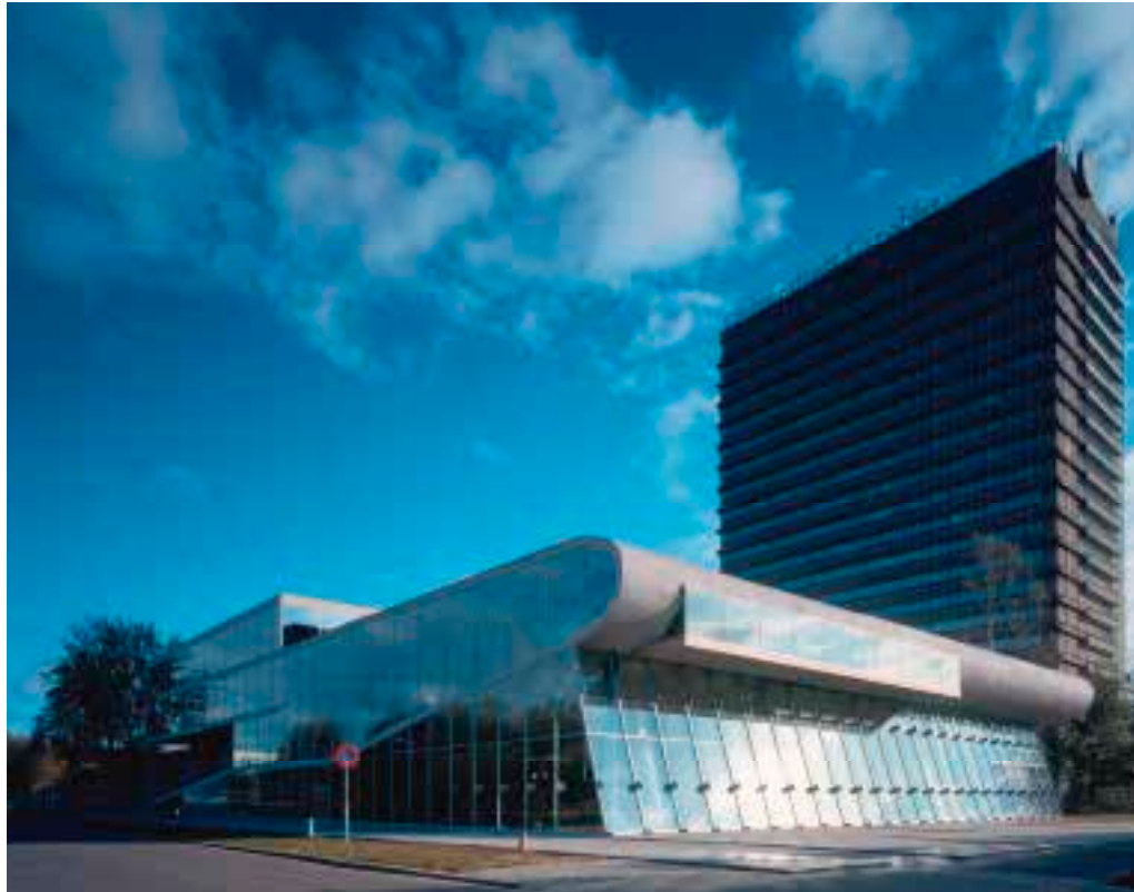
Linksboven Op de voorgrond het Educatorium, OMA