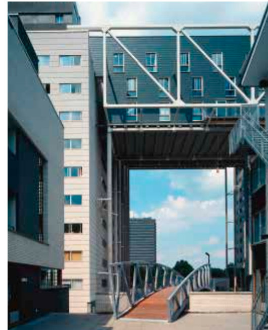
Links Interieur Minnaertgebouw, Neutelings Riedijk Architecten