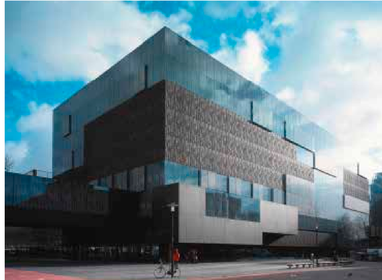
Boven Stedenbouwkundig plan, OMA/ Art Zaaijer